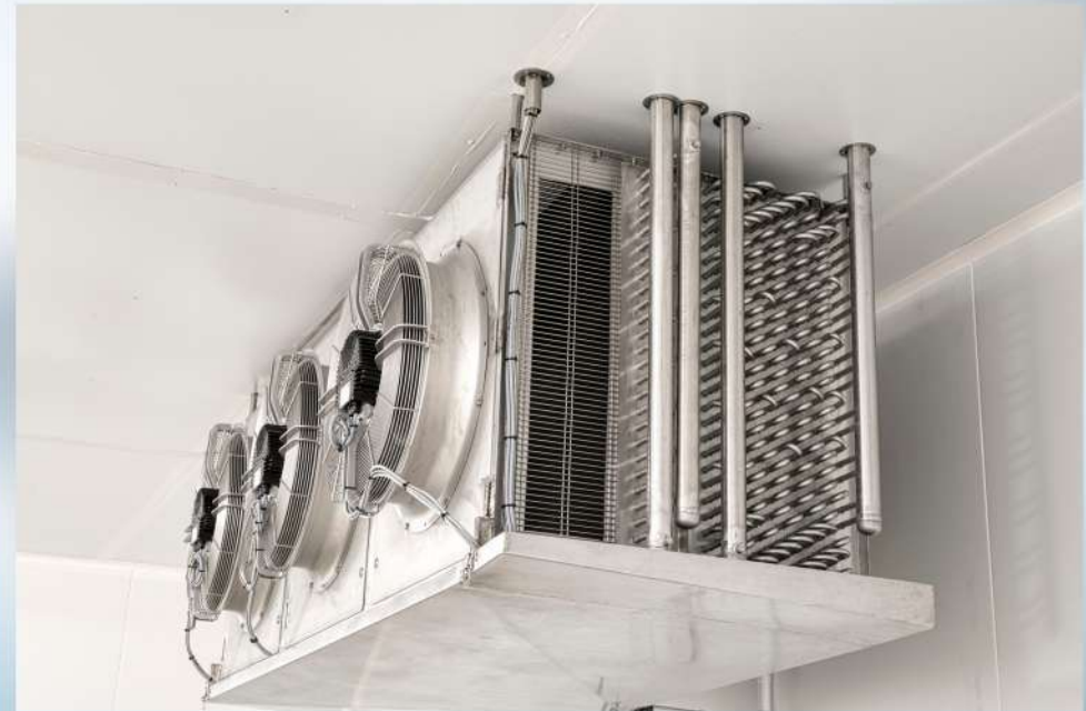
Echangeur tout inox sur mesure

Froid industriel Traitement d'air Climatisation