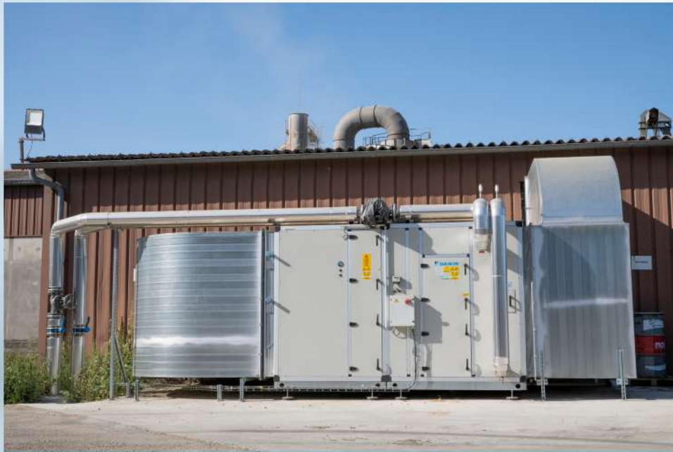
Caisson de traitement d'air