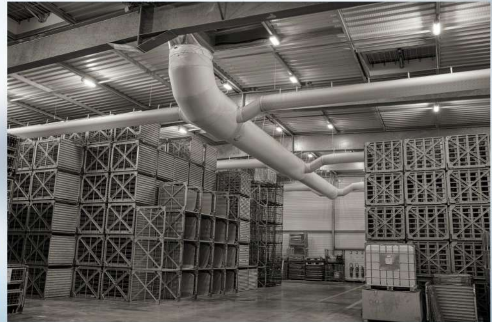
Diffusion gaine textile

Froid industriel Traitement d'air Climatisation